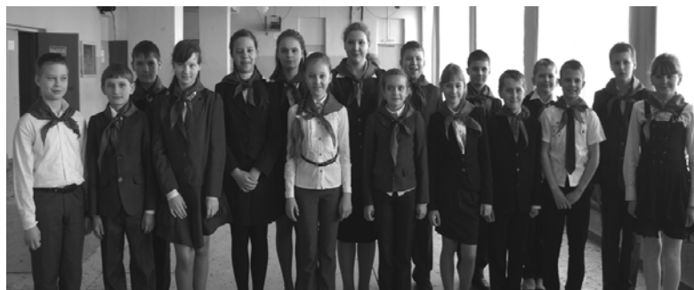
Ученики 5 А класса Краснинской средней школы. В числе других 11 апреля они дали торжественную клятву юных гагаринцев и были приняты в их ряды

По сложившейся традиции 11 апреля накануне Дня космонавтики в районном Доме культуры прошла торжественная церемония посвящения в гагаринцы. Более 70 мальчишек и девчонок приняли в этот день присягу. Они поклялись быть достойными гражданами России, любить свой край и прославлять его, быть готовыми на добрые дела и поступки.