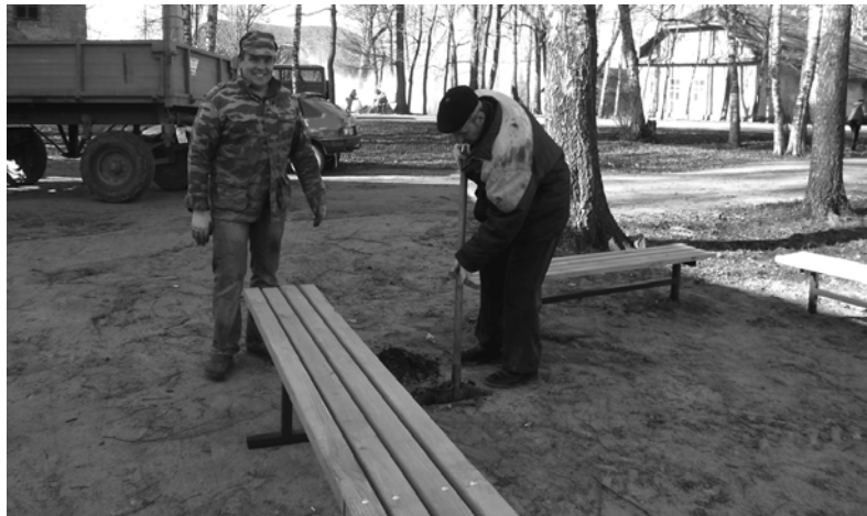
Новые скамейки на радость всем

Как же стало красиво кругом! Такая совместная работа приносит огромную пользу. Давайте почаще устраивать такие мероприятия! Кто,