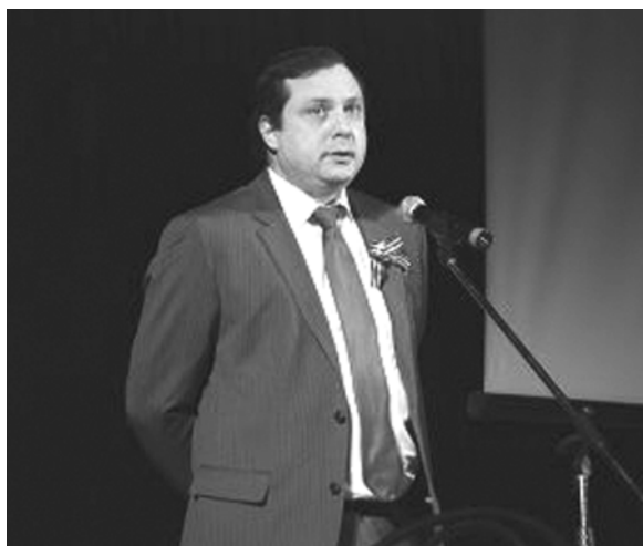
...и будем стараться помогать, я вас от имени администрации Смоленской области в этом заверяю. Спасибо».

Низкий поклон всем тем, благодаря кому мы живем, вам, дорогие ветераны. Мы кланяемся, благодарим вас и сожалеем о том, что мы – власть не можем сделать в полном объеме то, чего вы от нас ждете. Но мы стараем-