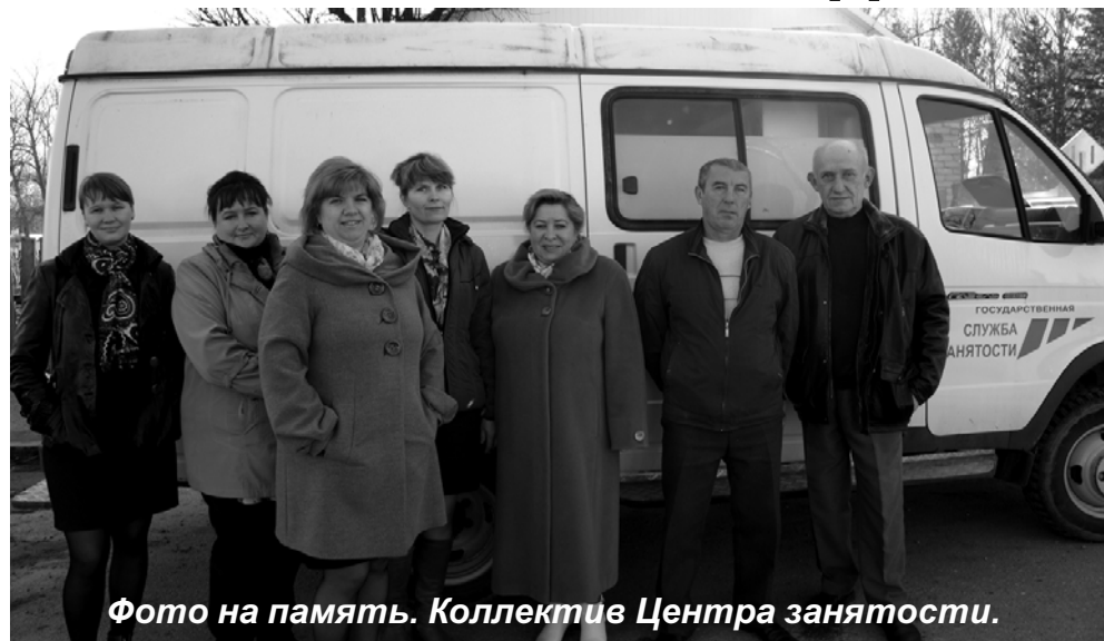
Фото на память. Коллектив Центра занятости.

19 апреля принимают поздравления профессионалы своего дела, работающие в службах занятости, обладающие знаниями и опытом, которые позволяют им решать проблемы рынка труда на высоком профессиональном уровне. 19 апреля 1991 года был принят Федеральный Закон «О занятости населения в Российской Федерации». Именно этот день принято считать датой образования государственной службы занятости населения России и профессиональным праздником работников этого института. Службы занятости были призваны оберегать жителей России от безработицы: информировать об имеющихся вакансиях, переобучать, поддерживать в период вынужденного простоя.