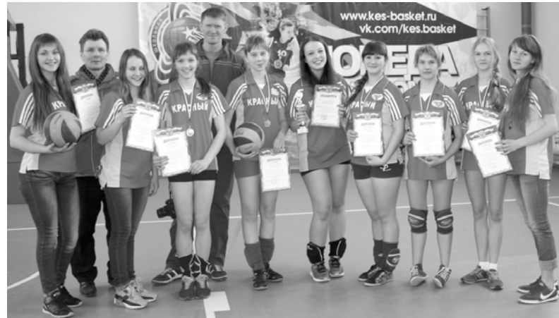
Фото на память. Сборная команда девушек по волейболу

Завершились областные соревнования по волейболу среди команд девушек. 14 марта в п. Хиславичи сборная команда девушек Краснинского района участвовала в зональных отборочных соревнованиях по волейболу.