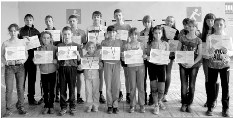
На фото - победители и призеры