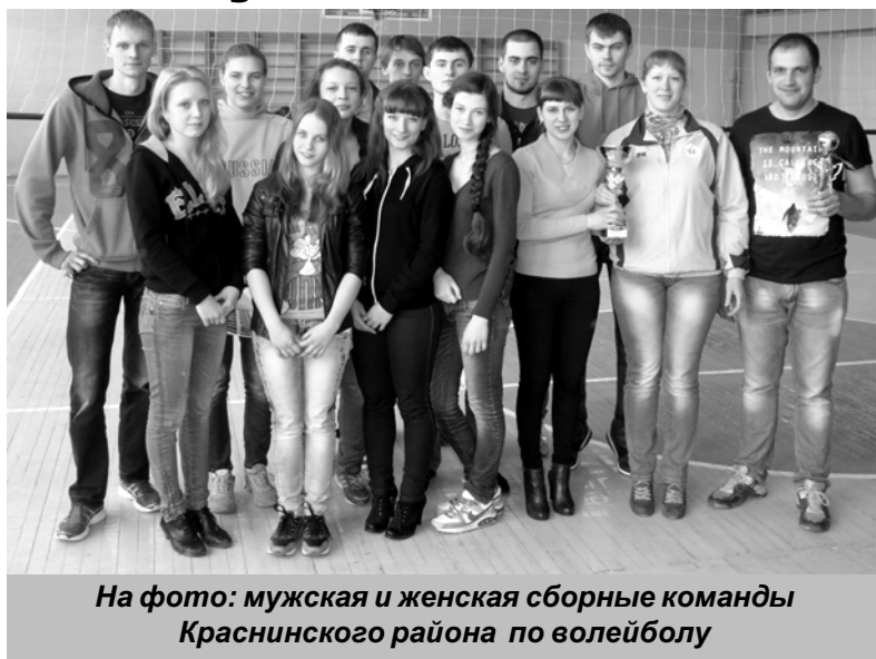
На фото: мужская и женская сборные команды Краснинского района по волейболу

В соревнованиях мужских команд приняли участие шесть команд,