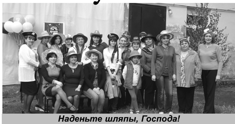
Наденьте шляпы, Господа!