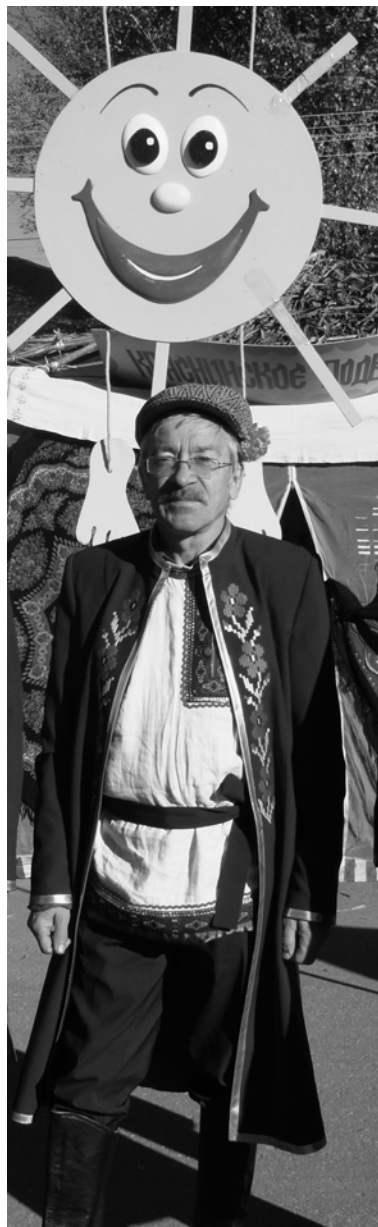
ден Почетной грамотой Смоленской областной Думы.

За свою трудовую деятельность получил немало поощрений, различных наград за участие и победы в фестивалях и конкурсах. Но, наверное, самой высокой наградой считает Гран-при, полученное на фестивале "Вихровские зори", проходившем в п. Моностырщина в 1988 году из рук Роксаны Бабаян и Владимира Шаинского. Так же имеет звание "Лучший работник культуры Смоленщины", награжден