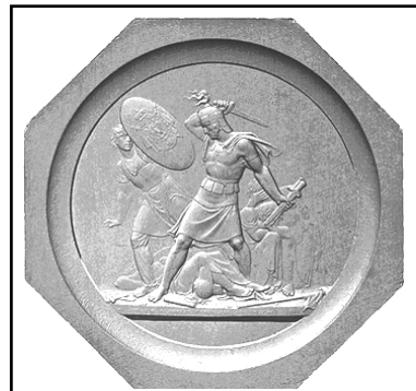
Ф.П. Толстой. Медаль "Трехдневный бой при г. Красном. 1812 г.". 1819 г.