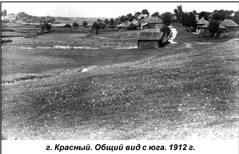
г. Красный. Общий вид с юга. 1912 г.

Приближался столетний юбилей победы России в войне 1812 года. Император Николай II отдал распоряжение фотохудожнику С.М. Прокудину-Горскому сделать серию снимков на тему "По местам войны 1812 года". В 1911-1912 гг., совершив поездку по России, Прокудин-Горский выполнил заказ. В 1911 г. он сделал фотографии Можайска и Бородина, а в 1912 г. - побывал в Малоярославце и в западных губерниях России, в том числе - в Смоленской губернии.