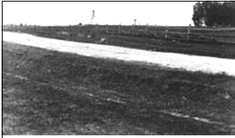
Общий вид места, где стоит памятник войны 1812 г. у г. Красного. 1912 г.

Интересна и судьба создателя бесценных для нас фотографий.