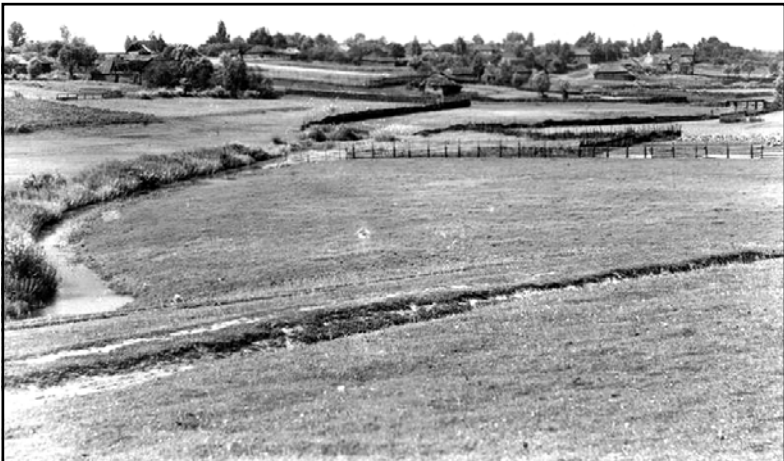
г. Красный. Общий вид с востока. Река Свиная, 49 верст от Смоленска. 1912г.

Перед нами фотографии Красного столетней давности! Вот как тогда выглядел уездный город Красный. Эти бесценные снимки переносят нас на 100 лет назад. Удивительно! Но кто оставил для краснинцев такую память? Кого мы можем поблагодарить за столь трепетное отношение к героической истории родного края?