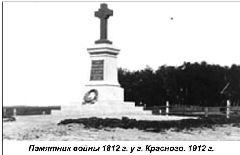
Памятник войны 1812 г. у г. Красного. 1912 г.