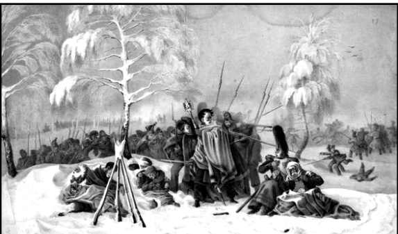
Х. Фабер дю Фор. "Между Корытней и Красным. 15 ноября 1812 г."