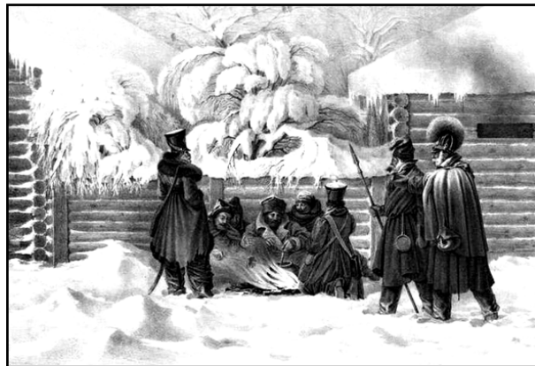
Х. Фабер дю Фор. "Бивак в Красном. 16 ноября 1812 г."

Бивак (бивуак) - расположение войск для ночлега или отдыха под открытым небом. Во время войны он представлял то, что войска в самое короткое время могут расположиться на отдых или сняться и отправиться в дальнейший поход.