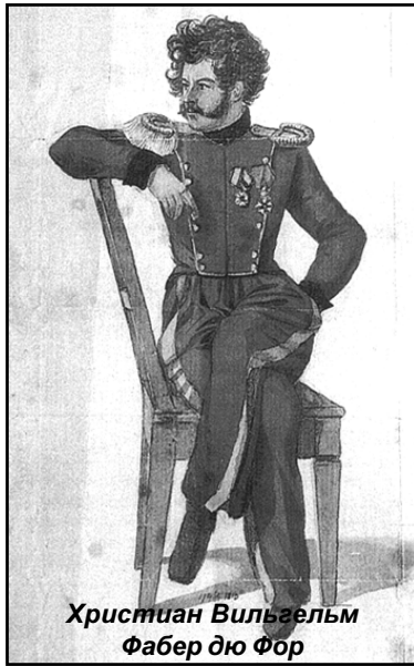
Христиан Вильгельм Фабер дю Фор

Исполненные Фабер дю Фором акварели с военными сценами находились в коллекции вюртембергского короля. Ныне вся серия акварельных рисунков, посвященных походу в Россию, хранится в собрании Баварского музея армии (г. Ингольштадт, Германия).