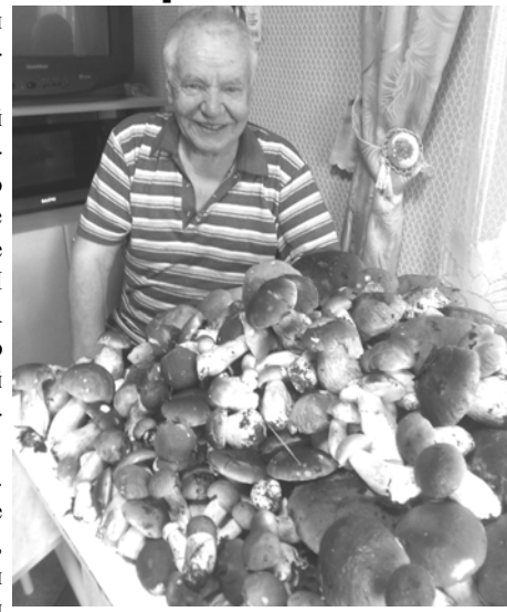
Небывалый урожай боровиков

Кстати, уже пошли опять. Говорят, что люди за ними тоже с мешками в лес ездят. Так что, уважаемые читатели, ждем ваши интересные фотографии на конкурс.