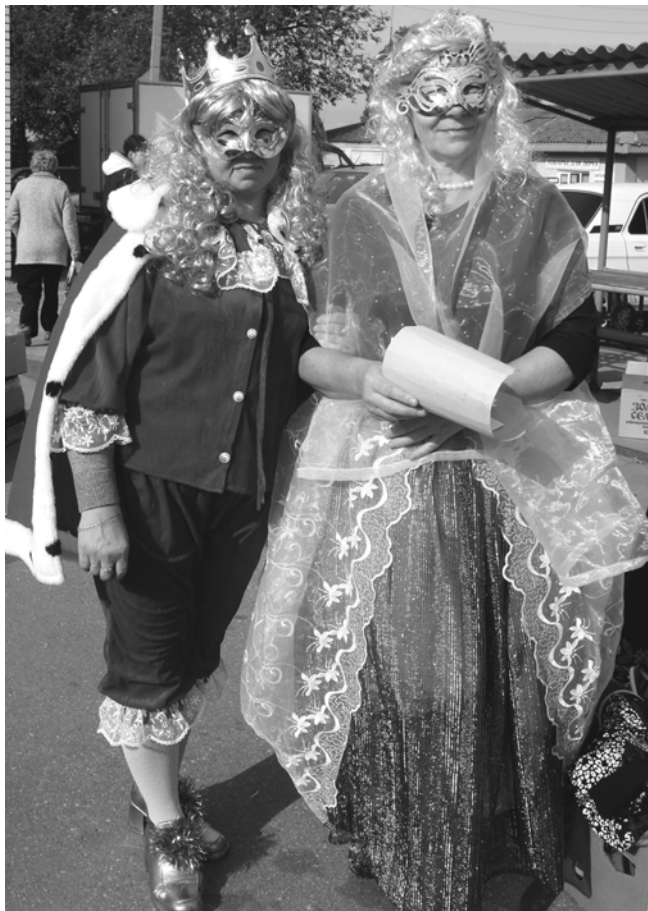
Перед подворьем Викторовского сельского поселения важно дефилировали король с королевой. Всем гостям они зачитывали только что изданный Указ.