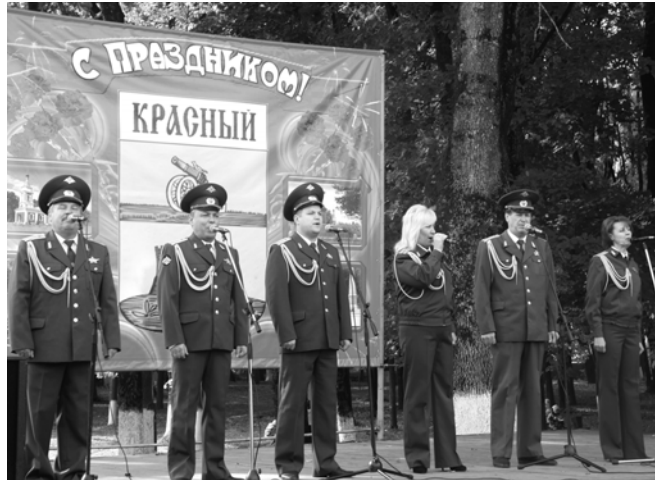
Всех краснинцев от души поздравил ансамбль песни и танца «Витязь» Смоленской областной филармонии.

В тот субботний день на центральной площади поселка хватало развлечений для людей самого разного возраста.