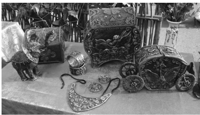
Согласитесь, красивые изделия. Кажется, что их совсем недавно нашли вместе с каким-нибудь старинным кладом. На самом деле это обыкновенный картон. Но до чего же правдоподобно сделано. Не отличишь от медных...