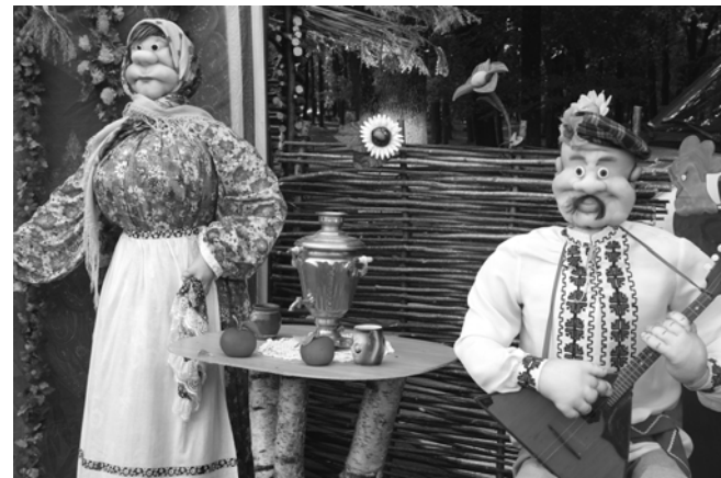
Зайти на Краснинское подворье всех приглашали баба с дедом, которые уютно расположившись за столом, пили чай из самовара.