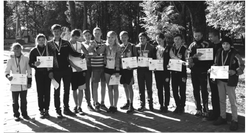
Победители и призеры соревнований

Очень радостно видеть, что ребята любят спорт, хотят быть здоровыми, крепкими и красивыми. В соревнованиях приняли участие 97 школьников района - это показатель того, что в районе есть спортивное поколение, которое надо приумножать, развивать и укреплять. Это наше с вами будущее и об этом не надо забывать никогда.