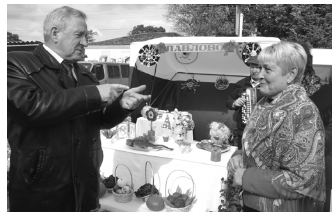
Павловское подворье тоже отличилось на празднике. Его хозяева привезли с собой только что пойманную в местном озере рыбу. А еще говорят, что она у нас не водится. Водится, да еще какая!

Что ни говорите, а гулять мы умеем широко, с размахом. И кстати, деньги не все и не всегда определяют.