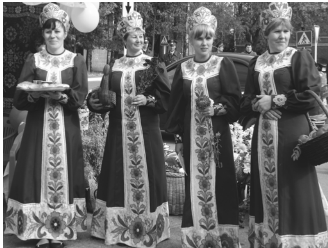
У каждого подворья, представленного на площади, была своя изюминка для привлечения гостей. Например, Мерлинское сельское поселение представляли четыре девчонки-хохотушки.