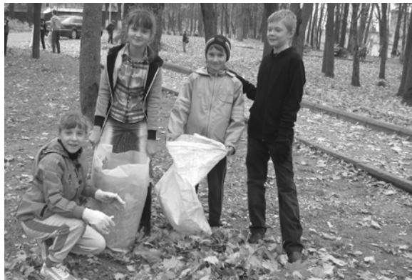
Ученики Краснинской школы проводят уборку территории.

воспитания школьников. Наши дети должны знать, чем меньше мусора будет вокруг, тем легче будет дышать планета, а значит и здоровье людей не будет ухудшаться. В ходе акции школьники поняли, как необходима их помощь и забота пожилым людям.