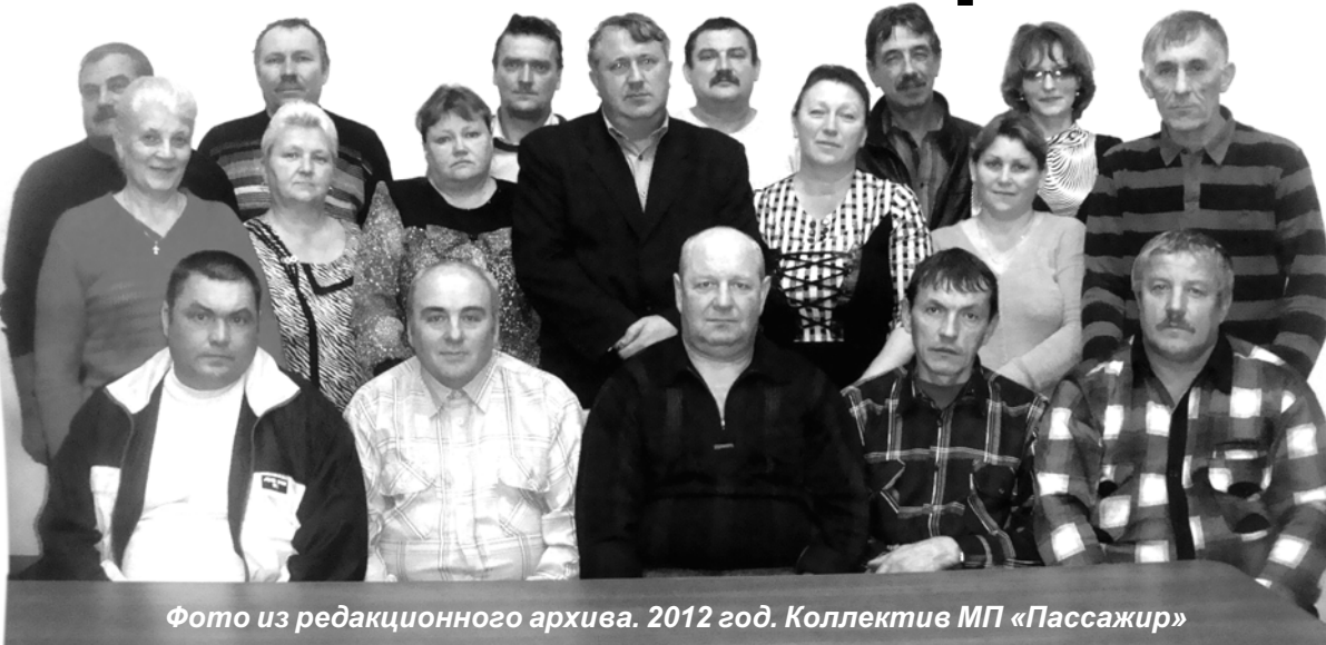
2012 год. Коллектив МП «Пассажир»

День Автомобилиста и Дорожного работника, который традиционно отмечается каждое последнее воскресенье октября, это праздник всех тех людей, без которых просто немыслима наша сегодняшняя жизнь. Пассажирские и грузовые перевозки - основа всех основ современной цивилизации. Этот праздник могут с уверенностью считать своим водители автобусов и грузового автотранспорта, а также строители дорог и рядовые автолюбители. Одним словом все те, кто большую часть своего рабочего времени проводит на асфальтном полотне дороги.