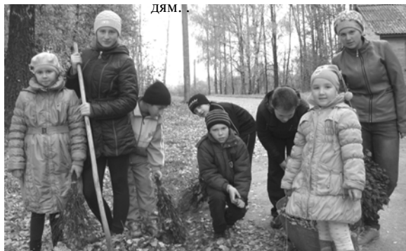
Ученики Марковского филиала убирают школьную территорию.