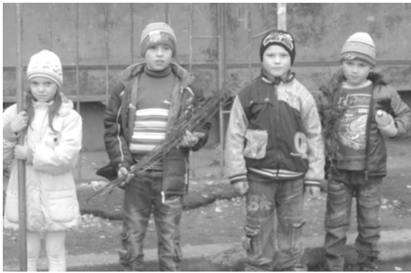
Первоклассники Глубокинской школы убирали автобусную остановку

В образовательных учреждениях нашего района прошла акция "Мы приглашаем вас на акцию". С 8 по 22 октября школьники убирали мусор на территории парков, аллей, дворов, занимались благоустройством спортивных и детских площадок,