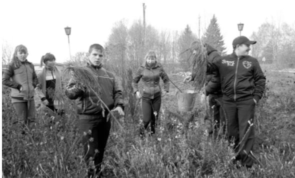
Ученики Мерлинской средней школы убирают школьную территорию