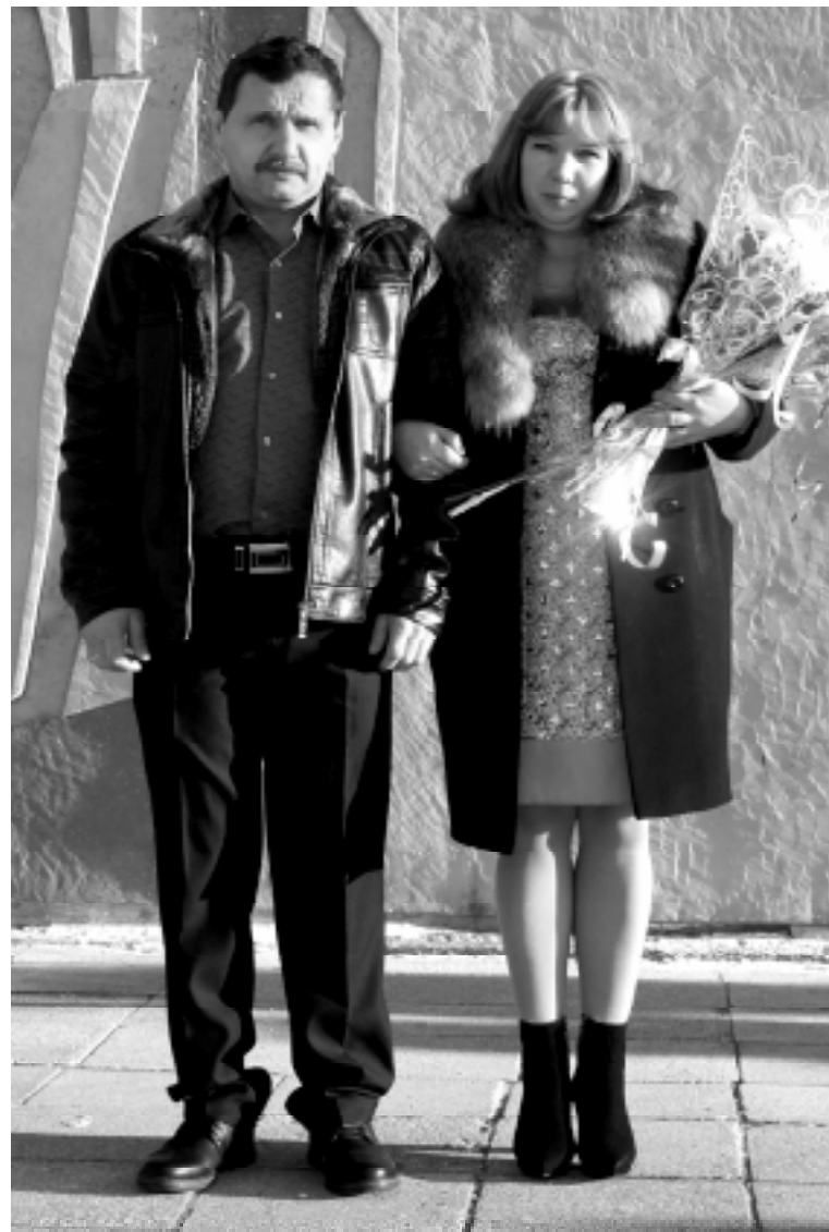
На фото - счастливые молодожены

В последние дни 2014 года в нашем районе родилась новая семья, которая в отделе ЗАГС была зарегистрирована под номером 100.