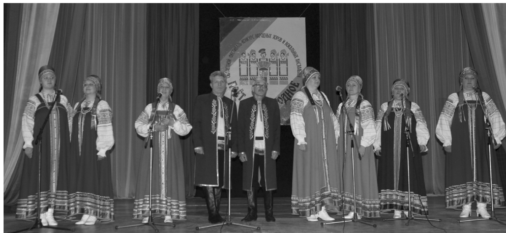
Выступает народный ансамбль народной песни «Родники»

Департамент Смоленской области по культуре и туризму, Смоленский областной центр народного творчества в течение всего ноября проводили по межрайонной схеме областной фестиваль-конкурс народных хоров и вокальных коллективов «Поёт село родное».