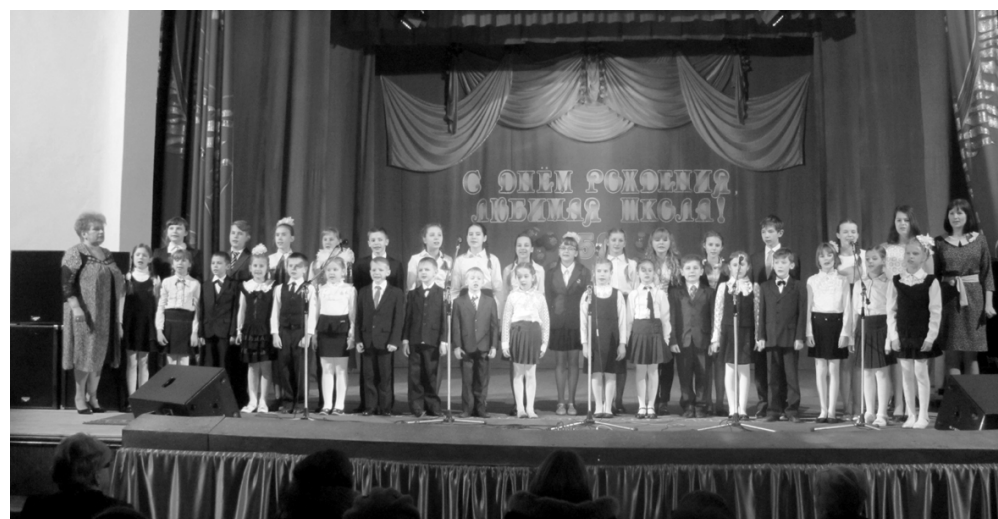
Ученики детской школы искусств