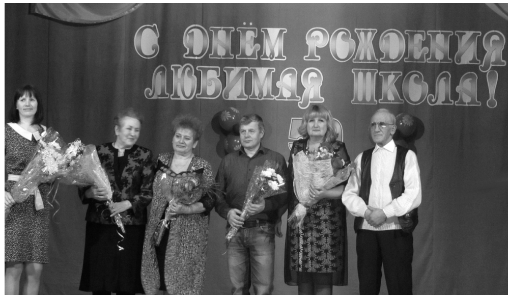
Преподаватели детской школы искусств

Документ рассмотрен и одобрен на заседании Правительства Российской Федерации 8 декабря 2016 года.