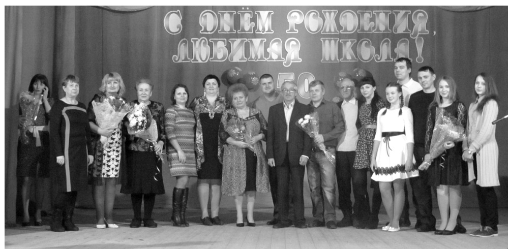
Преподаватели и выпускники детской школы искусств