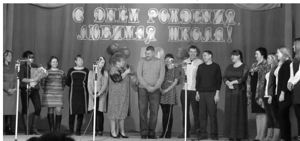
Выпускники детской школы искусств