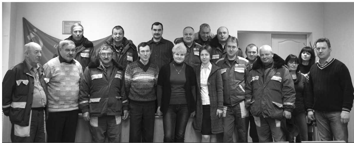
Коллектив Краснинского РЭС. Фото на память.

Свой профессиональный праздник энергетики отмечают в один из самых коротких световых дней в году - 22 декабря. Трудно переоценить значение работы людей, чьим неустанным трудом создается одно из самых необходимых благ, которое обеспечивает комфорт в домах, школах, больницах, учреждениях и организациях.