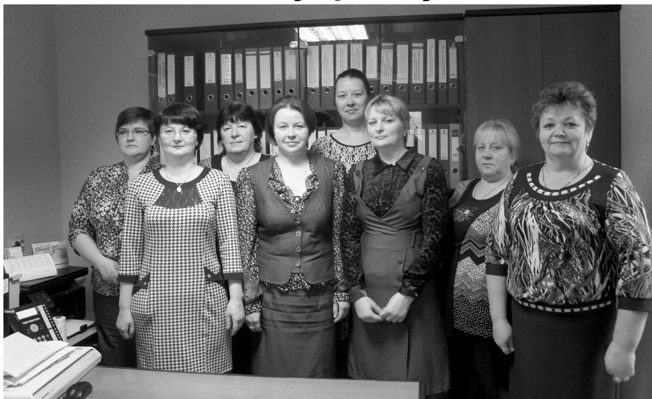
Фото на память. Коллектив отдела Пенсионного фонда в Краснинском районе.

Пенсионный фонд Российской Федерации образован 22 декабря 1990 года для государственного управления финансами пенсионного обеспечения в Российской Федерации. Пенсионный фонд России является самостоятельным внебюджетным фондом, денежные средства которого не входят в состав федерального бюджета, других бюджетов и фондов и не подлежат изъятию на другие цели, кроме выплаты пенсий.