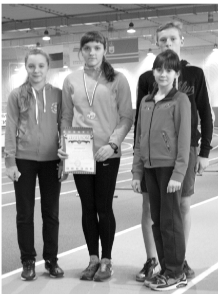
Команда Краснинского района

Администрация спортивной школы благодарит всех ребят за высокие результаты и поздравляет всех тренеров - преподавателей и спортсменов с наступающим Новым годом и Рождеством. Желаем всем крепкого здоровья, спортивных результатов, успехов и удачи.