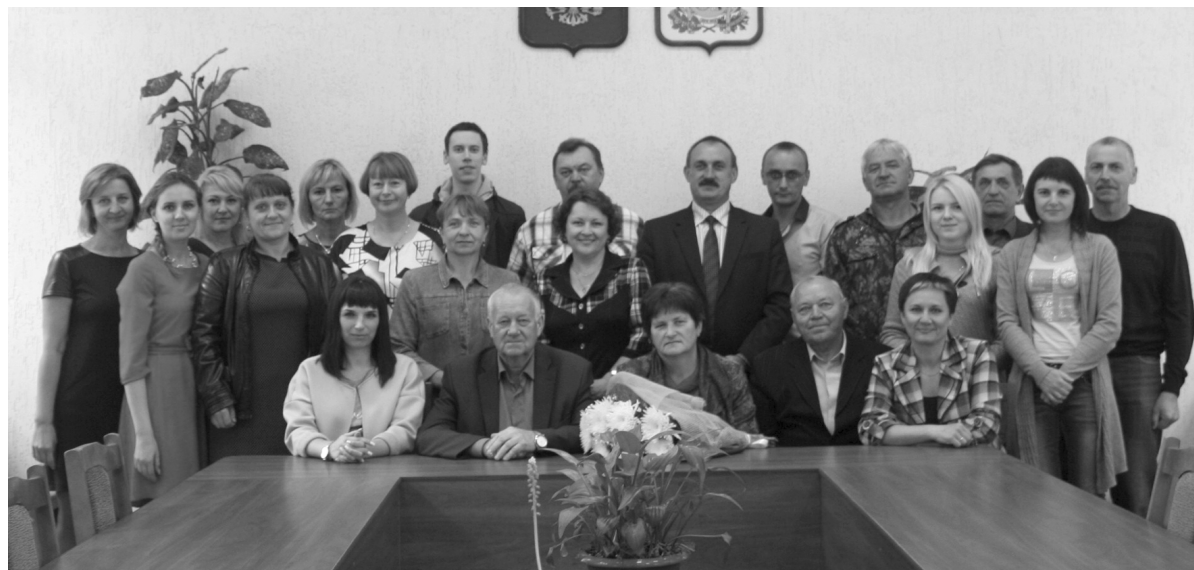
КОЛЛЕКТИВ АДМИНИСТРАЦИИ МО «КРАСНИНСКИЙ РАЙОН»

Сила государства в его служащих, в их способности и желании поднимать страну. Делать работу современной, успешной, безопасной, каждую минуту помнить, что от вклада муниципальных работников в жизнь района зависит степень его развития и уровень благосостояния его граждан.