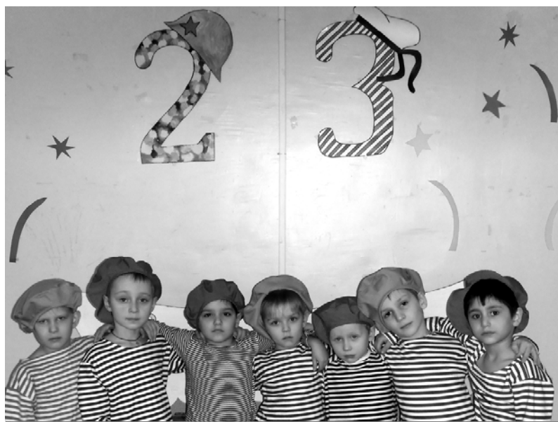
Воспитанники детского сада «Белочка».

21 февраля в детском саду "Белочка" д.Гусино прошёл праздник, посвящённый Дню защитника Отечества. 23 февраля в детском саду - это возможность лишний раз напомнить мальчикам о том, что такое смелость, отвага, благородство и мужество. Детей встречал празднично украшенный зал. Все воспитанники на время стали героями поучительной истории "Как Баба Яга внука в армию провожала". Конкурсы для детей, включающие в себя состязания на меткость, ловкость, внимательность, демонст-