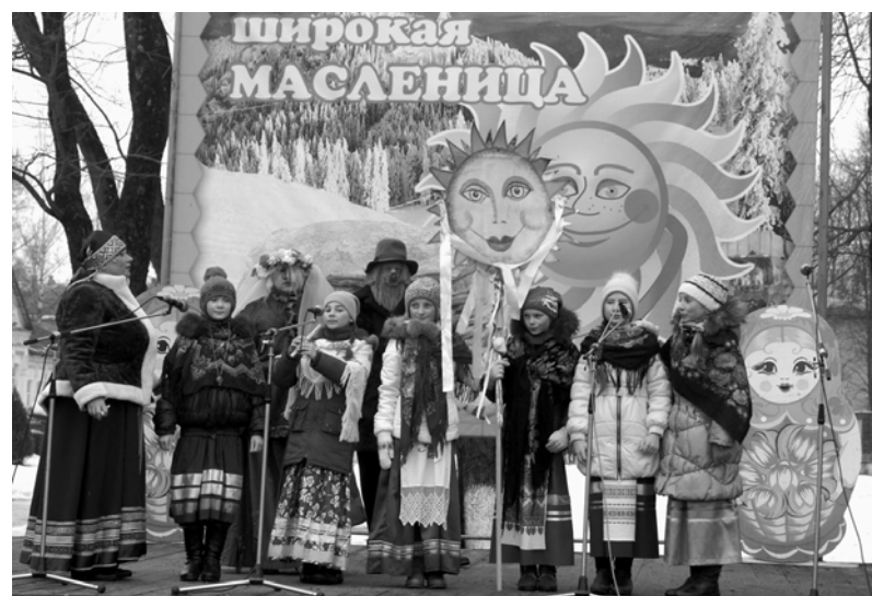
Выступление воспитанников детской музыкальной школы

На центральной площади поселка прошел аттракцион развлечений и традиционных масленичных забав, в которых приняли участие и взрослые, и дети. Организаторами такого большого гуляния выступили администрация Краснинского городского поселения и отдел культуры.