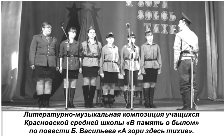
Литературно-музыкальная композиция учащихся Красновской средней школы «В память о былом» по повести Б. Васильева «А зори здесь тихие».