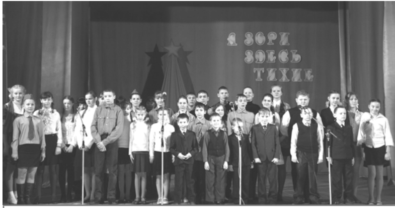
Участники фестиваля «А зори здесь тихие».

Жюри высоко оценило выступление ребят, а председатель жюри Де-