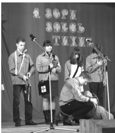
Инсценированная песня «Последний бой». Учащиеся Гусинской средней школы