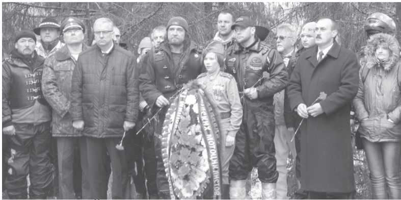
МИНУТОЙ МОЛЧАНИЯ ПОЧТИЛИ ПАМЯТЬ ПОГИБШИХ