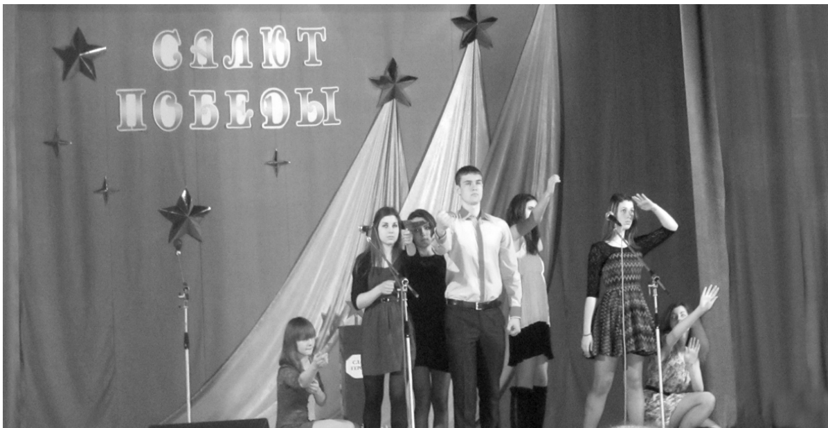
На фото: один из моментов фестиваля

Всего в фестивале примут участие более 20 районов области. Совсем скоро жюри оценит мастерство и творческий уровень всех участников и определит коллективы, которым будет присвоено звание "Лауреат областного фестиваля народного творчества "Салют Победы" с вручением дипломов I, II, III степени. Нам остается только надеяться, чтобы наши районные артисты тоже попадут в число победителей.