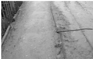
Этот кусок арматуры уже давно торчит на тротуаре возле моста.

Есть вещи, на которые можно смотреть молча, где-то в глубине души, скомкав недовольство, есть вещи, с которыми мириться нельзя.