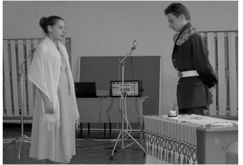
Участники кружка «Художественное слово и театр».