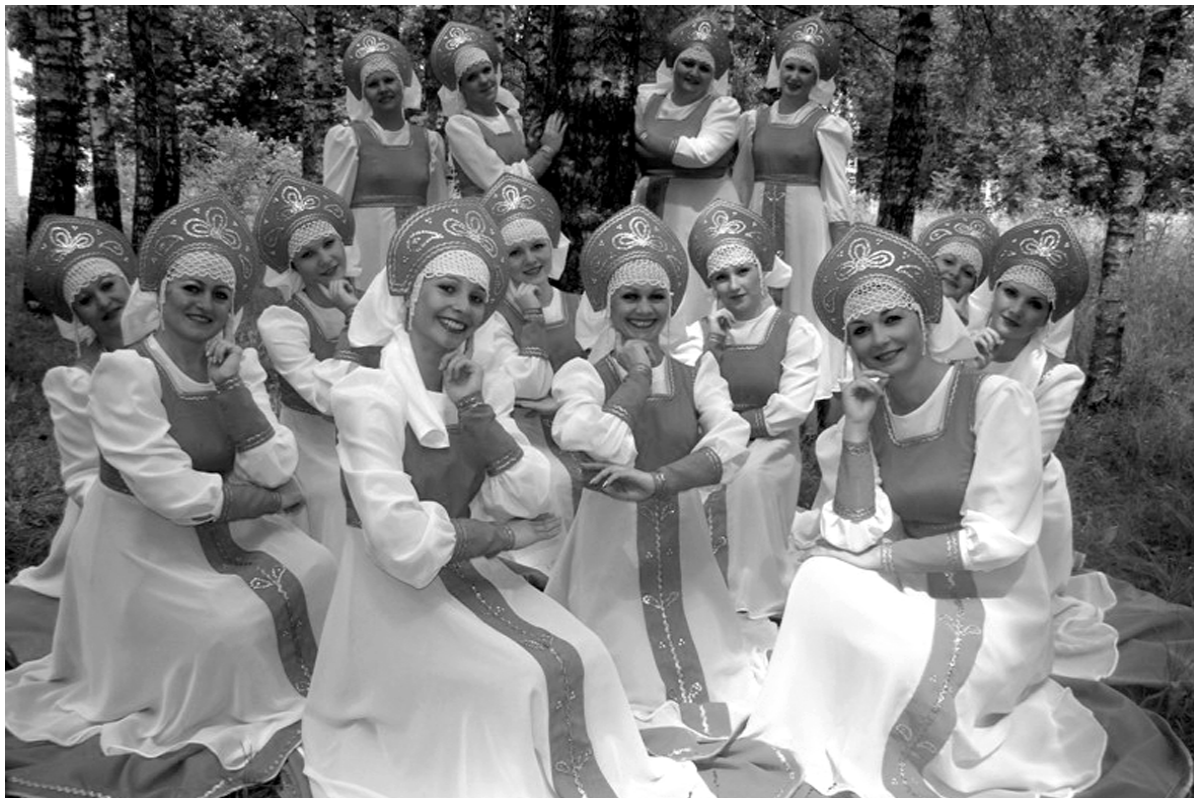
Хореографический коллектив «Вдохновение». Фото из архива 2012 год.

Адрес электронной почты в информационно-телекоммуникационной сети Интернет: krasniiy@admin-smolensk.ru .