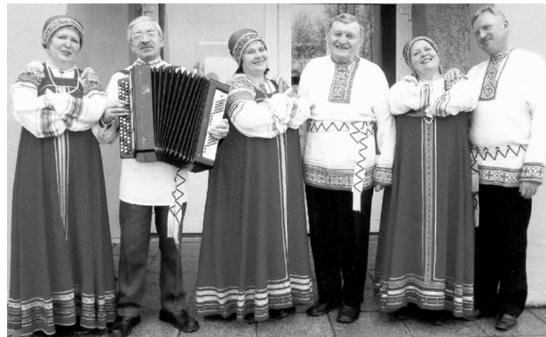
Отдел нестационарного обслуживания

Мы искренне радуемся тем достижениям, которых вы добиваетесь: это победы на конкурсах и выставках, рост числа посетителей в музее и зрителей на концертах. Безусловно, в значимые успехи, достигнутые районом, вложена весомая толика вашего труда, личного участия, постоянной заботы о земляках.