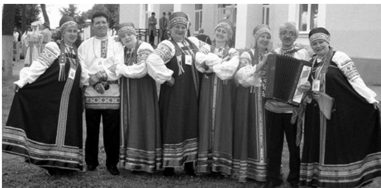
Ансамбль народной песни «Родники». Фестиваль «Днепровские голоса» 2010 год.

Губернатор Смоленской области А.В. ОСТРОВСКИЙ.