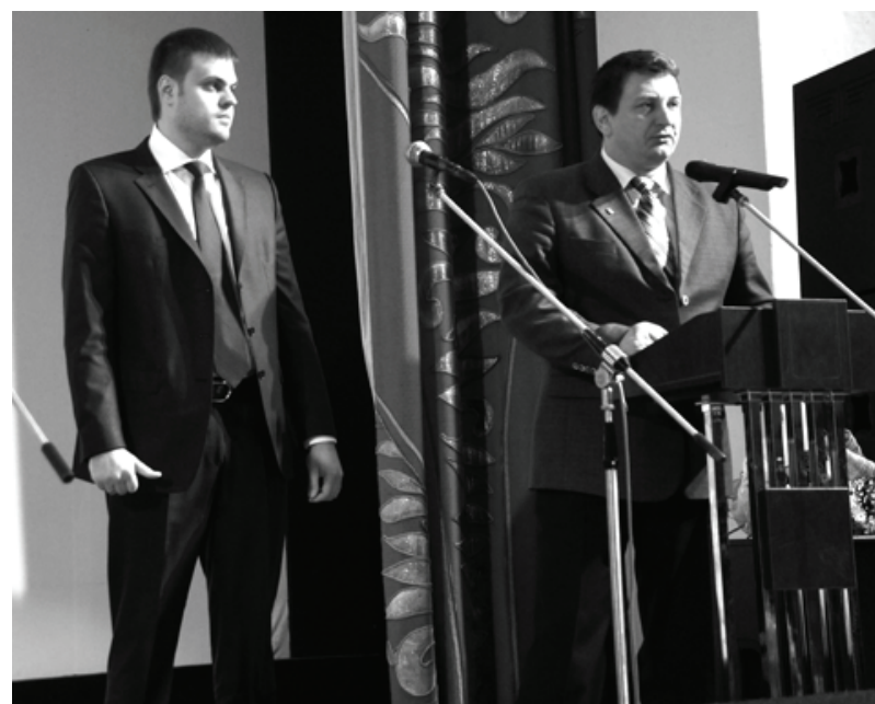
На фото слева направо: депутат Смоленской областной Думы Артем Туров и вице-губернатор Игорь Ляхов.