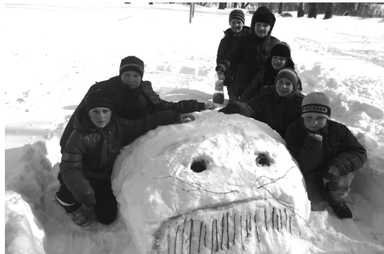
На снимке: учащиеся Глубокинской средней школы. Вот такой снежный кит у нас получился!

Работа в оздоровительных учреждениях, в первую очередь, ориентируется на создание комплекса условий и мероприятий, обеспечивающих охрану и укрепление здоровья детей и подростков, занятий физкультурой и спортом, профилактику заболеваний, полноценные завтраки, обеды и полдники. В школах заранее разрабатывается режим работы оздоровительного учреждения,