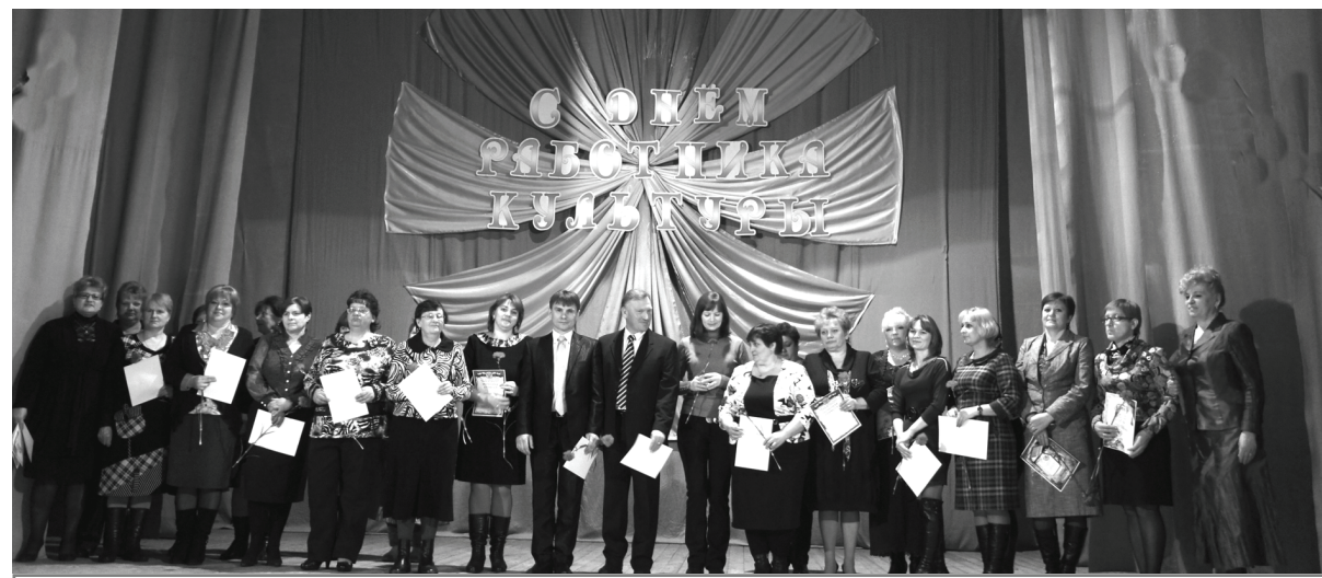
Фото на память. Лучшие из лучших.

Пусть почет, слава и уважение всегда будут рядом с вами. Пусть