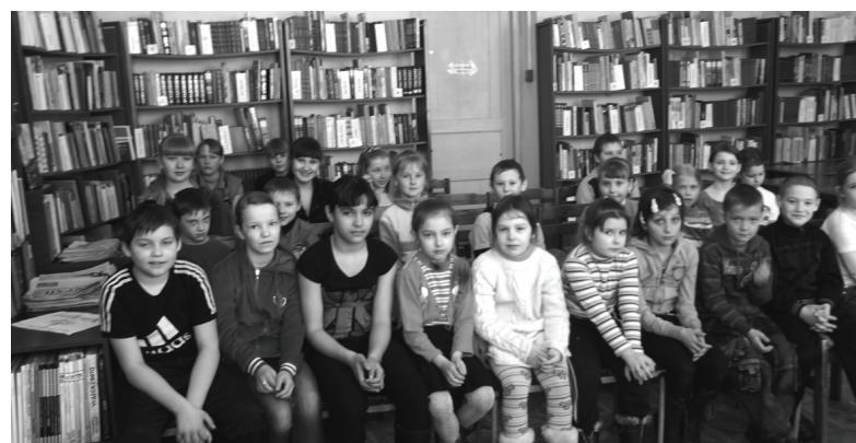
Учащиеся Краснинской средней школы на мероприятии в центральной детской библиотеке.

На протяжении вот уже целого ряда лет в школах нашего района во время каникул проводится оздоровление детей. Значительные учебные нагрузки, гиподинамия, несбалансированное питание и другие неблагоприятные факторы приводят к напряжению эмоциональной сферы детей, снижению функциональных возможностей их организма. В полной мере это