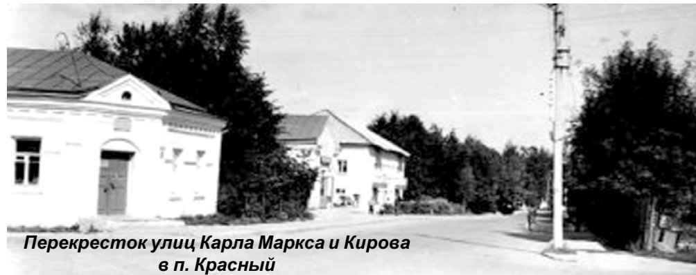
Перекресток улиц Карла Маркса и Кирова в п. Красный