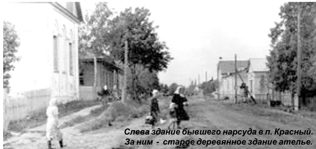
Слева здание бывшего нарсуда в п. Красный. За ним - старое деревянное здание ателье.

Приносите фотографии с вашими комментариями в редакцию газеты "Краснинский край" по адресу: п. Красный, улица Кирова, д. 4 или присылайте по электронной почте: krasnkray@rambler.ru. Не забудьте написать ваши имя, телефон и адрес.