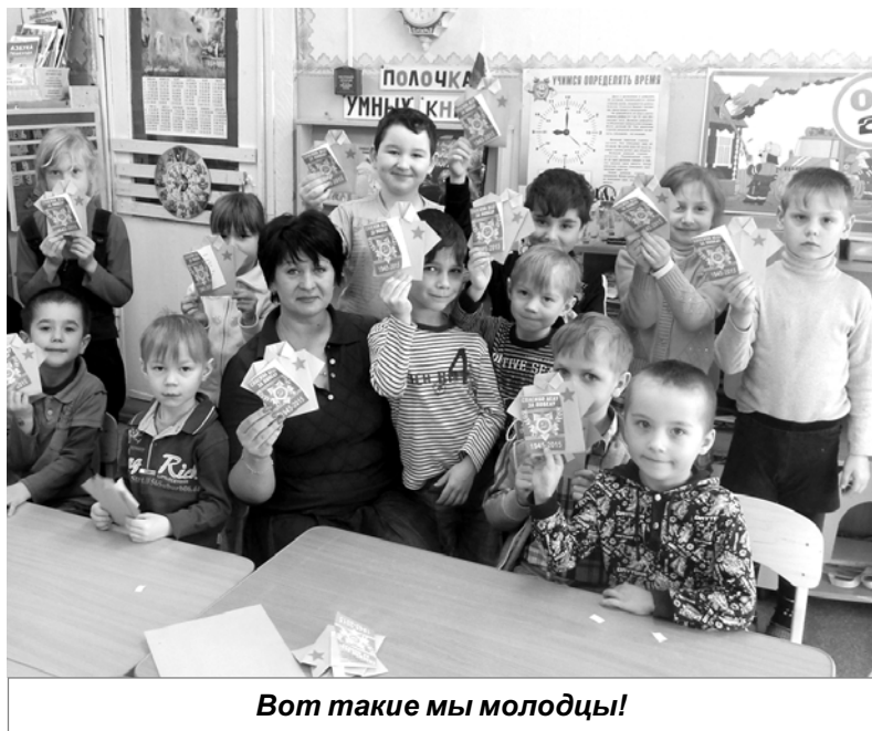
Вот такие мы молодцы!

Кроме того, что дети своими руками учились моделировать при помощи бумаги цветков, они также про-