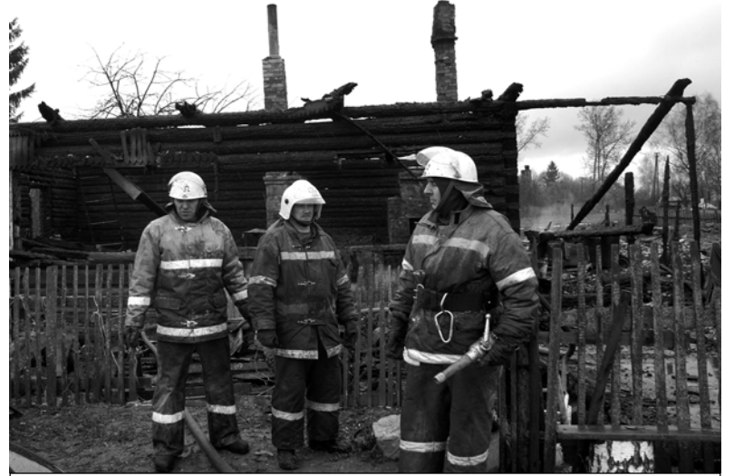
Сотрудники ПЧ-32 на месте пожара