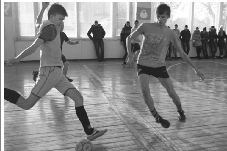
На фото: момент игры

6 января в спортзале районного Дома культуры состоялся Рождественский турнир среди учащихся и групп ДЮСШ. Соревнования проходили по двум возрастным группам: младшая группа (2001 г.р. и моложе), старшая (2000 г.р. и старше). Все игры в подгруппах проходили по круговой системе.