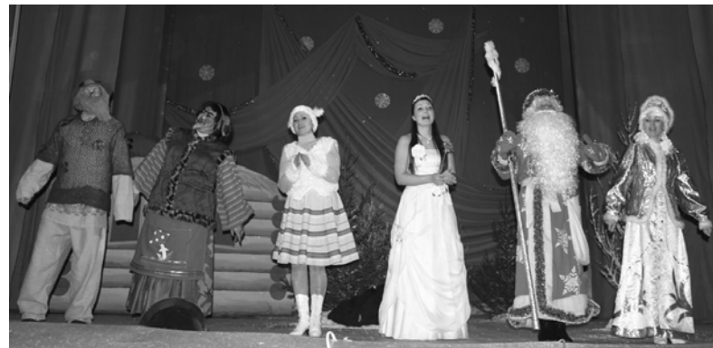
Герои веселой новогодней сказки