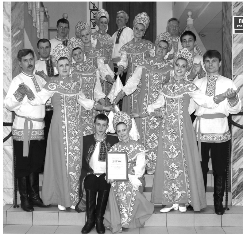
Взрослая группа народного хореографического коллектива «Вдохновение»

И вот объявили итоги. Взрослая группа народного хореографического коллектива "Вдохновение" МБУК "Краснинская РЦКС" с хореографической композицией "Лирический хоровод" становится победителем об-