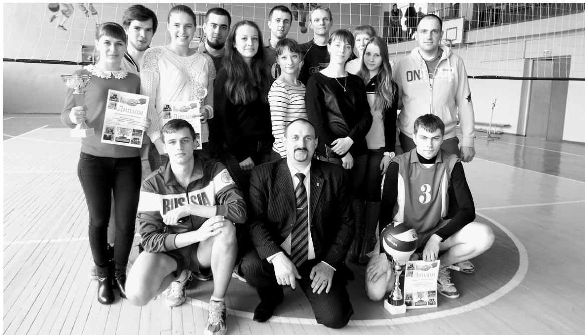
Фото на память. На международном турнире, посвященном единению народов России и Беларуси и 70-летию Победы в Великой Отечественной войне.

4 апреля в районном Доме культуры прошли отборочные соревнования по волейболу среди женских команд области в зачет XXXVI летней спартакиады муниципальных образований Смоленской области. В них приняли участие команды из Руднянского, Демидовского и Краснинского районов.