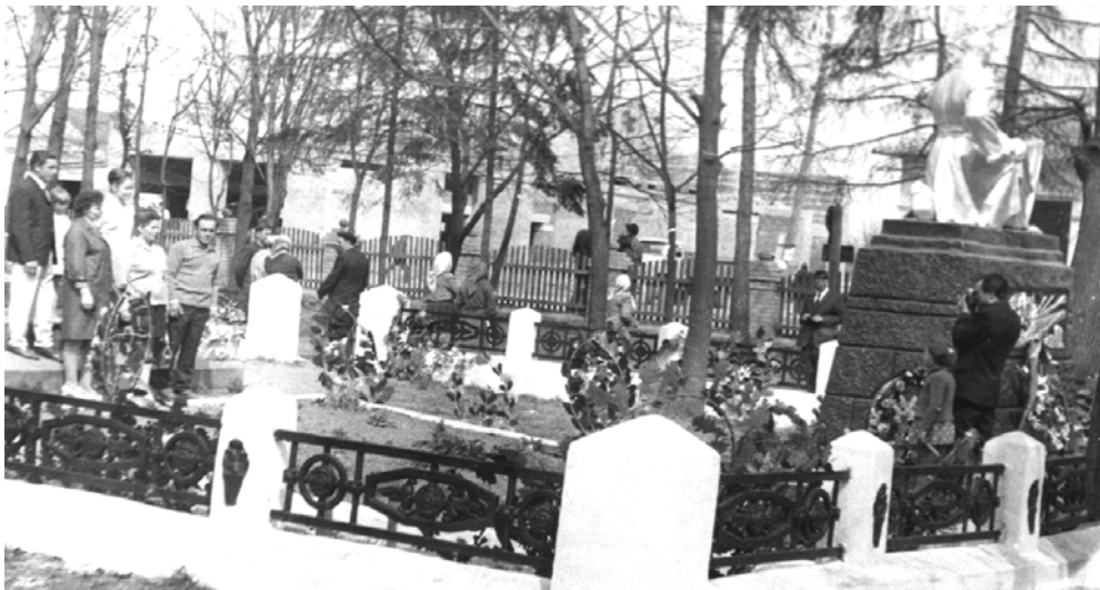
После митинга. 9 мая 1971 года.