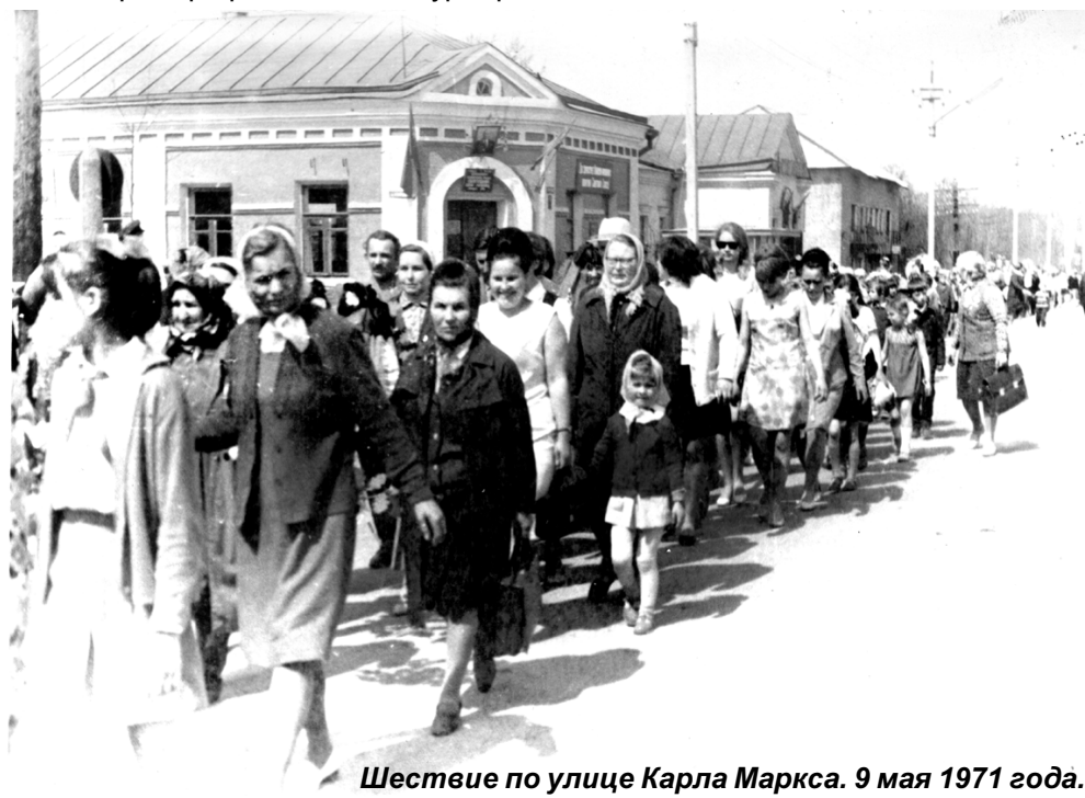
Шествие по улице Карла Маркса. 9 мая 1971 года.