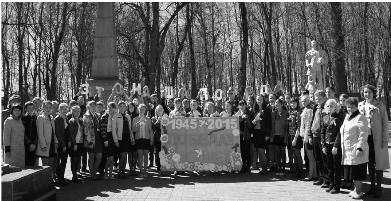
Фото на память. Флешмоб - Праздничная открытка ко Дню Победы: «Мы правнуки Великой Победы! Мы гордимся подвигом наших прадедов! Бережно храним частички ваших воспоминаний, дорогие наши! Это ваша Победа! Это наша Победа! Победа каждого человека!

Акции, которым в этот день дали старт в районе, лишь часть большой планомерной работы по патриотическому воспитанию подрастающего поколения. Она ведется в каждом общеобразовательном учреждении.