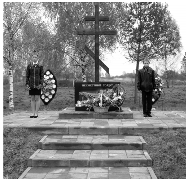
Памятный знак «Неизвестный солдат»

В этот же день в знак глубокого уважения, светлой вечной памяти всех погибших в Великой Отечественной войне к братской могиле, в которой захоронены останки 412 неизвестных советских воинов, были возложены цветы и венки. В 2008 году она была реконструирована по инициативе и на средства Краснинского районного суда. С тех пор его сотрудники считают своей почетной обязанностью заботу об этой могиле и уход за ней.