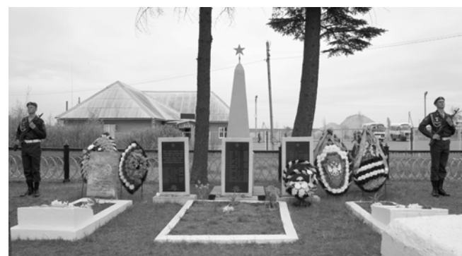
Братская могила № 3 у деревни Липово