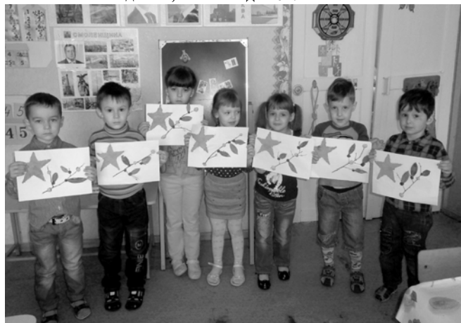
Праздничная открытка ко Дню Победы. Вот какие мы умельцы!

делились своими впечатлениями зрители, - хорошо, что наших детей и внуков воспитывают в духе патриотизма и любви к своей Родине».