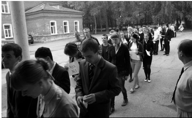
Выпускники отправляются по аудиториям

Надо сказать, что металлодетекторы все равно пищали при осмотре. Они реагировали и на пряжки ремней, и на заклепки на джинсах, и на металлические пуговицы на них же. Ребятам приходилось показывать во время осмотра, на что же у них так сработал металлодетектор. Процедура, прямо скажем, не очень приятная. Такую проводят обычно при входе на режимные объекты. Не скажу, что камеры вызвали у ребят большое волнение. Хотя, напряжение ощущалось в каждой аудитории. Впрочем, о том, что чувствовали выпускники, мы сможем узнать только у них самих. Но сегодня суббота. Напряжение от сдачи первого обя-