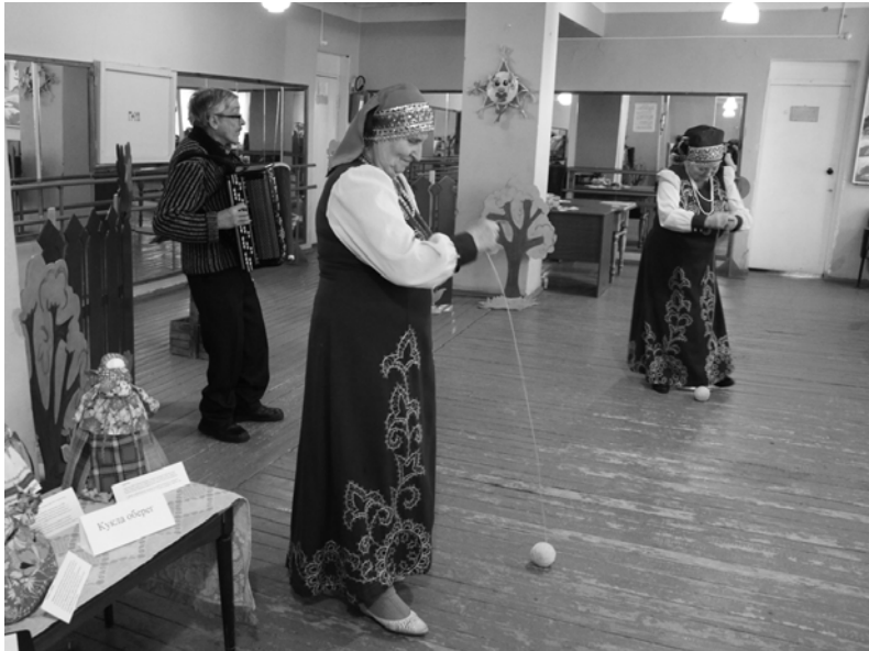
Конкурс на самого расторопного пенсионера