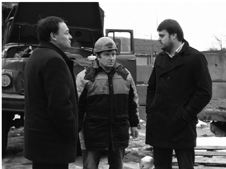
На стройплощадке детского сада в п. Красный