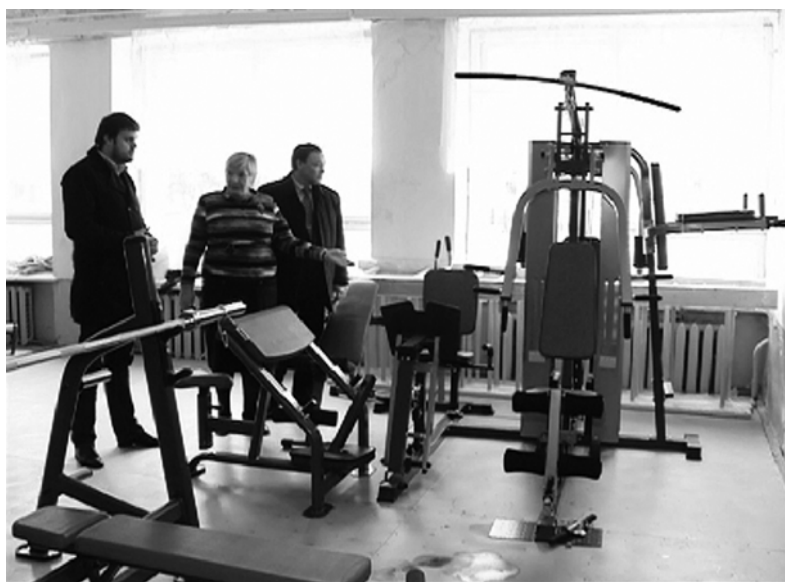
В спортивном зале Гусинской средней школы

месте. Стройматериалы для ремонта будут доставлены в Мерлино уже в январе.