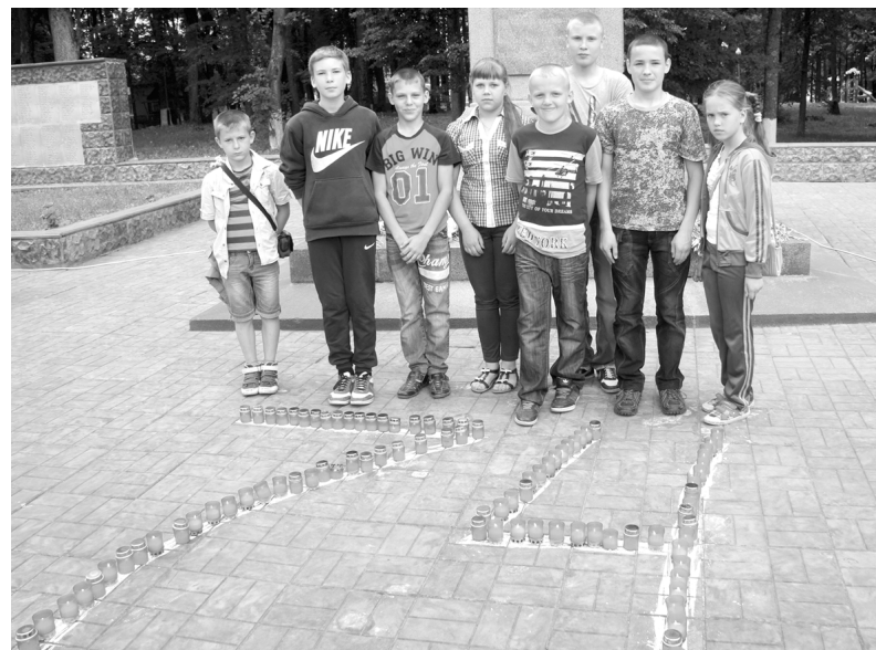
На снимке: ученики Глубокинской средней школы