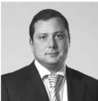
Губернатор Смоленской области А.В. ОСТРОВСКИЙ

Желаю вам здоровья и мира, семейного счастья и благополучия!