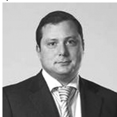
Губернатор Смоленской области А.В. ОСТРОВСКИЙ

Уважаемые работники почтовой связи Смоленщины!