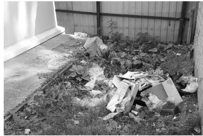
25 июля 2016 года. Стихийно растущая возле общественного туалета в п. Красный свалка.

Мы много рассуждаем о несанкционированных свалках, которые растут по обочинам дорог. А зачем далеко ходить? В центре поселка на виду у всех - гора мусора. Возле общественного туалета свалка тоже растет не по дням, а по часам. Мы, конечно,