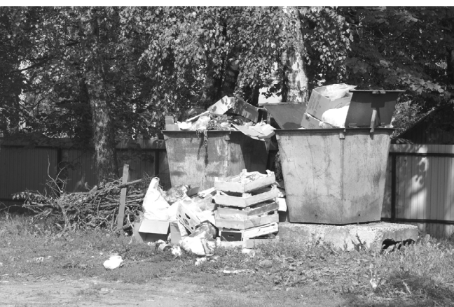
25 июля 2016 года. Так выглядит территория возле мусорных контейнеров во дворе здания городской администрации.

Эти фотографии были сделаны в понедельник, когда верстался очередной номер нашей газеты. Мы не исключаем возможности, что до среды, а именно в этот день выходит районка, мусор вывезут. Но этот факт никак не повлияет на актуальность наших снимков.