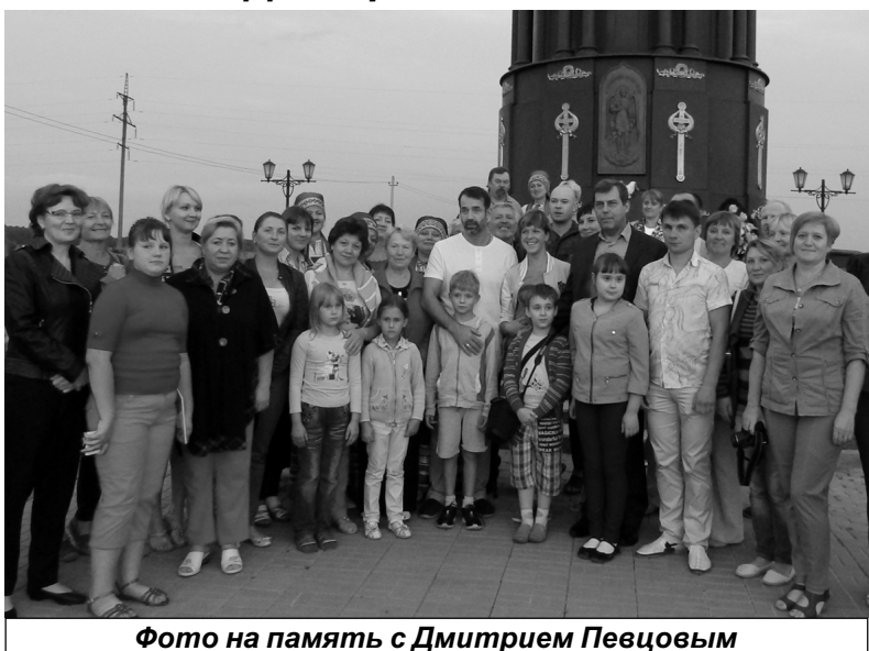
Фото на память с Дмитрием Певцовым

В минувшую пятницу в нашем районе проездом побывал российский актёр театра и кино, певец, заслуженный артист РФ, народный артист России Дмитрий Анатольевич Певцов.