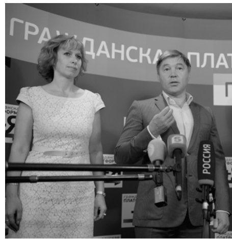
На фото: Лидер партии "Гражданская Платформа" Рифат Шайхутдинов и кандидат в Губернаторы Смоленской области Елена Лобанова

Председатель Политического комитета партии "Гражданская Платформа" РИФАТ ШАЙХУТДИНОВ о причинах сегодняшних проблем России и путях выхода из кризиса