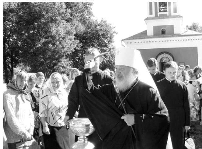
2005 год.

В 1709 году была возведена, опять же на средства крестьян дворцовой волости, деревянная Никольская церковь. В 1786 году был построен каменный Екатерининский собор по указу императрицы Екатерины II на пожертвованные ею деньги. Следующая кирпичная цер-