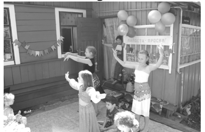
Юные артисты исполняют "Восточный танец"