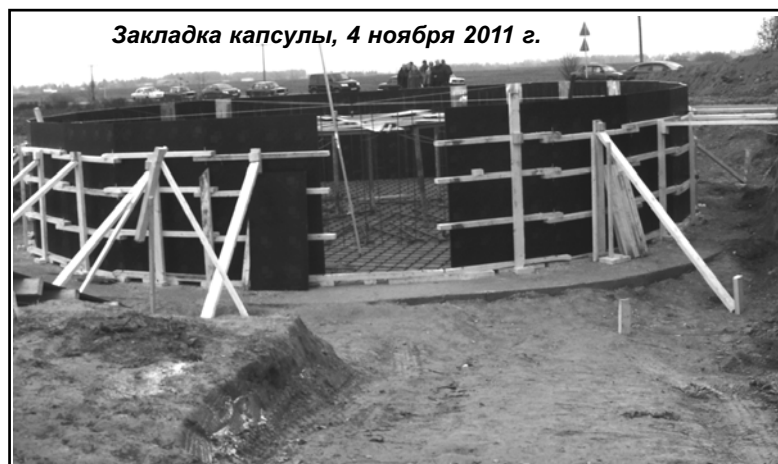
Закладка капсулы, 4 ноября 2011 г.

Краснинские старожилы рассказывали: когда памятник был взорван и расчленен, его тяжелые чугунные детали на мужицких подводах перевезли к днепровской пристани