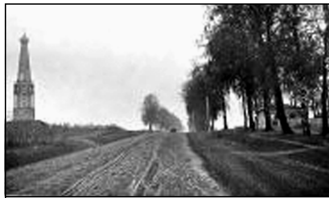
Памятник под Красным у Смоленского большака, 1847 г.

4 ноября 2011 года состоялась торжественная закладка памятной капсулы в фундамент воссоздаваемого памятника. К концу 2011 года памятник был воссоздан. В текущем году проводились работы по благоустройству территории вокруг памятника. Завтра 16 сентября состоится его торжественное открытие.