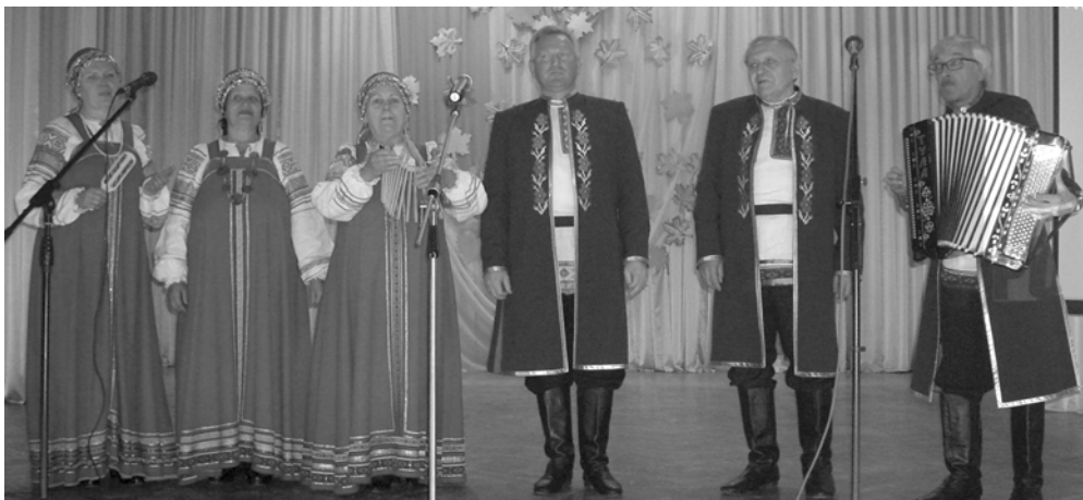
Вокальный ансамбль «Росинка»