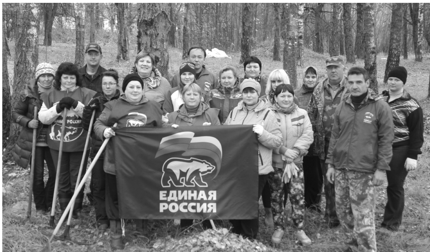
На фото - участники субботника

В минувшую субботу в рамках проекта «Чистый город» члены партии «Единая Россия» организовали и провели субботник в поселке Красный. Конечно, сегодня ситуация с уборкой коренным образом отличается от той, которая была несколько лет назад. Субботники стали для нас доброй традицией. Но для того, чтобы навести порядок в поселке, нужно сделать еще очень много. Именно поэтому Краснинское местное отделение партии приглашало всех желающих принять участие в субботнике. Активисты партии рассматривали эту акцию как акт единения жителей в стремлении сделать поселок чище и лучше.