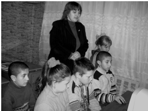
Литературный час в Марковском филиале