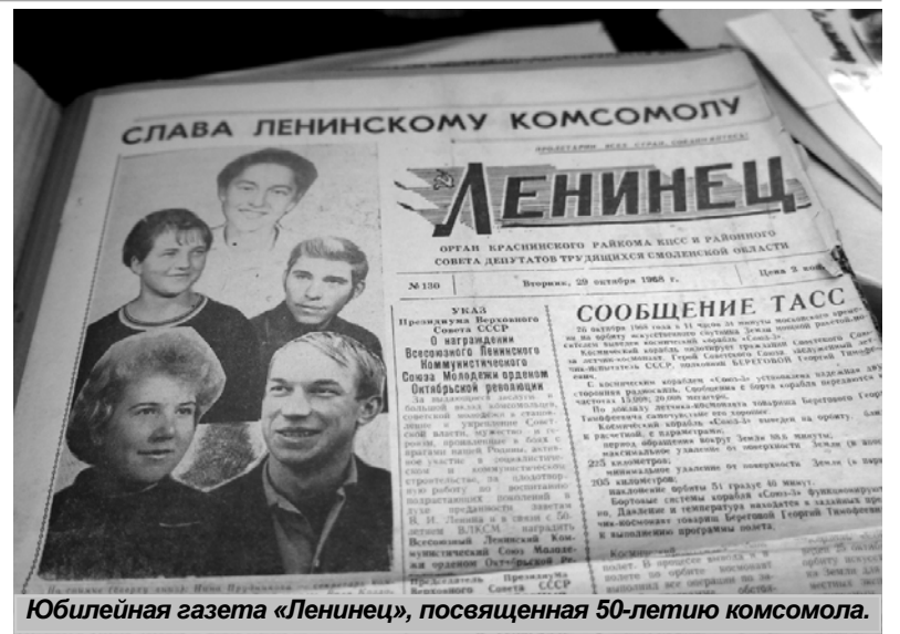
Юбилейная газета «Ленинец», посвященная 50-летию комсомола.

Сыграл свою роль комсомол и в восстановлении разрушенной войной страны, освоении целины, строительстве БАМа, во Всесоюзных ударных стройках. Комсомол направлял и распределял на работу по "Комсомольским путевкам", реализовывал жилищную программу "Молодежный жи-