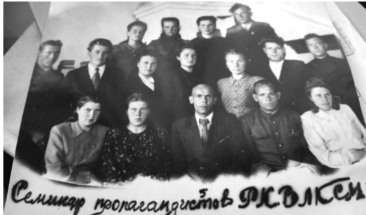
Семинар пропагандистов ВЛКСМ

ком в 1958 году. Об этом факте, видимо, некоторые наши кинорежиссеры не знают, потому что в некоторых военных фильмах, в которых есть герои-комсомольцы, на их кителях красуются комсомольские