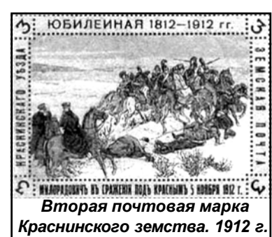
Вторая почтовая марка Краснинского земства. 1912 г.

Земские почтовые службы, как и другие земские учреждения, были ликвидированы в 1918 году, после установления Советской власти.