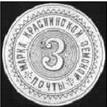
Марка земской почты Краснинского уезда

Земская почта Краснинского уезда Смоленской губернии была открыта 15 марта 1888 года. Корреспонденция отправлялась из уездного центра г. Красного в уезд 4 раза в неделю. С 1 января 1891 года начался прием частной корреспонденции и введены земские почтовые марки. Первые марки имели круглую форму. Марки 1891 года печатались с изображением губернского и уездного гербов. В 1912 году к 100-летию Отечественной войны 1812 вышли марки с посвященными ей сюжетами. Марки печатались способом многоцветной литографии в многочисленных вариантах: без зубцов, с углами разного цвета, на различных сортах бумаги. Гасились марки чернилами (перечеркиванием) и штемпелями.