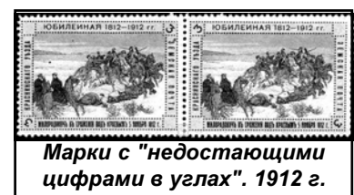
Марки с "недостающими цифрами в углах". 1912 г.

Земские почтовые службы, как и другие земские учреждения, были ликвидированы в 1918 году, после установления Советской власти.