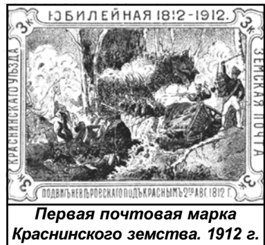
Первая почтовая марка Краснинского земства. 1912 г.

Земские почтовые службы, как и другие земские учреждения, были ликвидированы в 1918 году, после установления Советской власти.