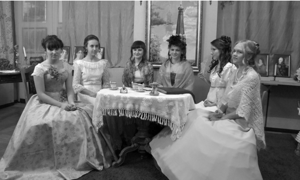
Участники литературной гостиной