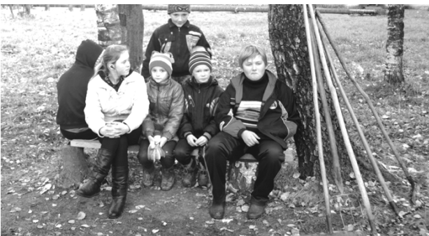
«На привале». Недвижский филиал Глубокинской средней школы.

Все образовательные учреждения района серьезно отнеслись к поставленным задачам. Ребята вместе со взрослыми убирали территории вокруг школ, детских и спортивных площадок, возле памятников. Результаты работы были оформлены в презентации, видеоролики.