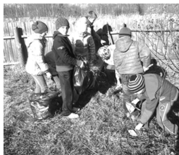
«Мы и в школе, и дома работаем на славу», - воспитанники Дома творчества.