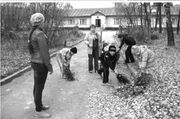
«По дорожке к знаниям». Марковский филиал Глубокинской средней школы.