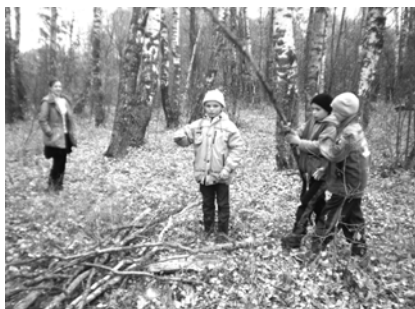
«Маленькие помощники». Малеевский филиал Краснооктябрьской средней школы.