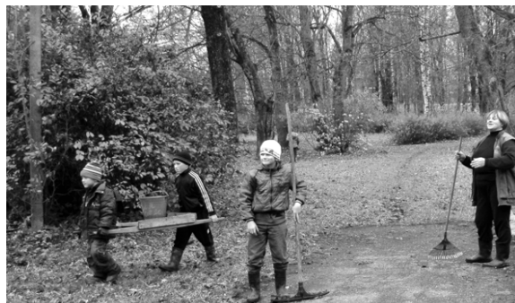
«Хорошо потрудились». Викторовский филиал Глубокинской средней школы.