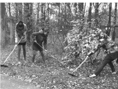
«Чтобы вокруг стало чище, чтобы наша малая родина стала еще лучше!» Гусинская средняя школа.