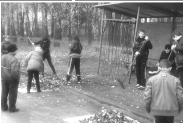
«Берите с нас пример!» - учащиеся Глубокинской средней школы.